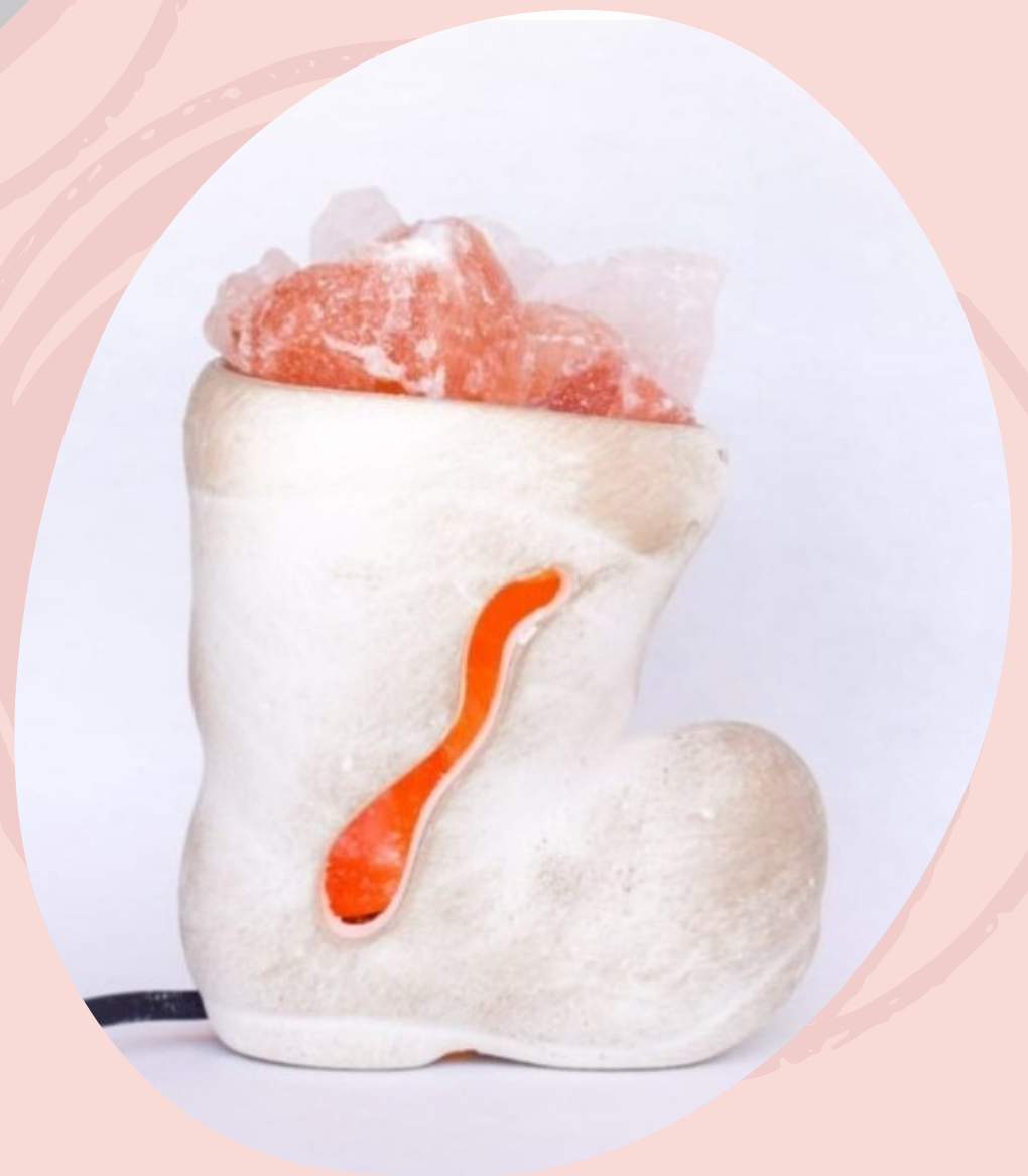
Lampara botita con cable y foco. (Línea económica)