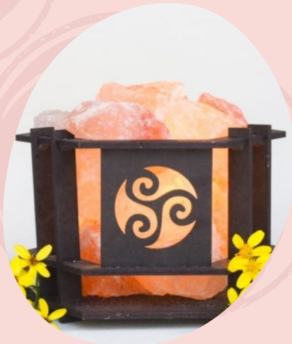
Lampara de Sal Thor. Limpia y purifica el ambiente