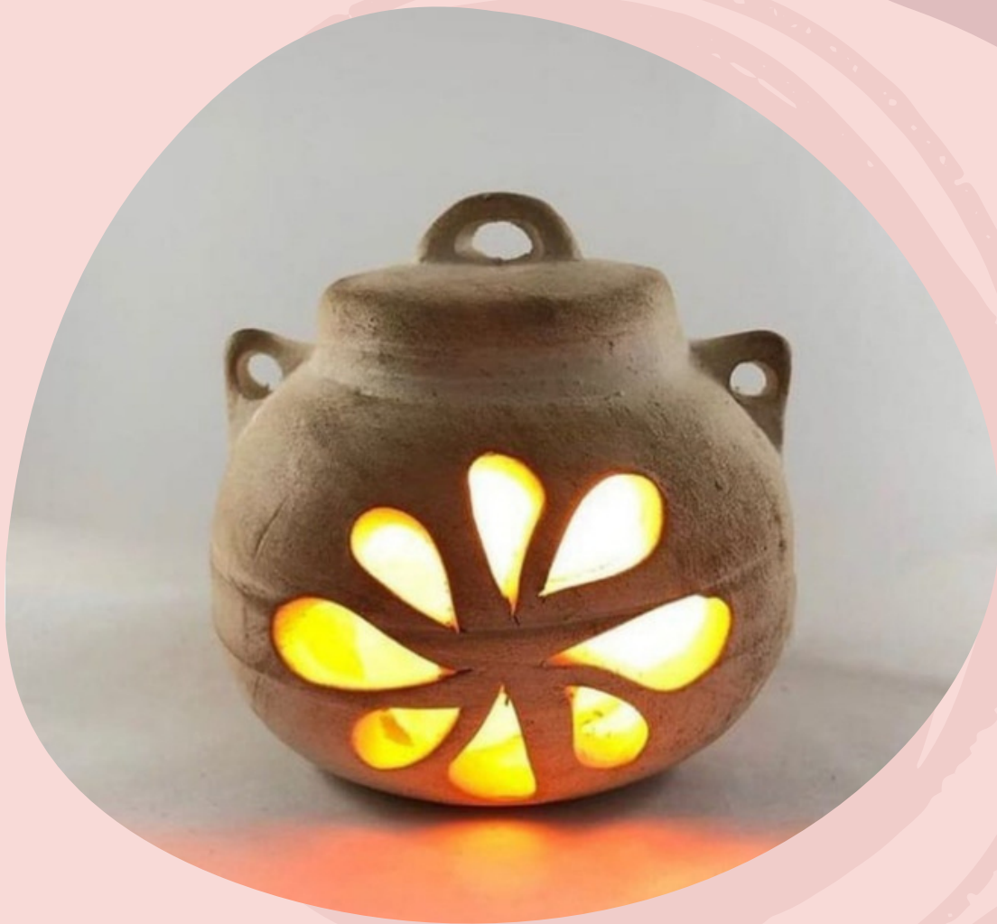
Lampara de Sal del Himalaya Tete con cable y foco. (Línea económica)