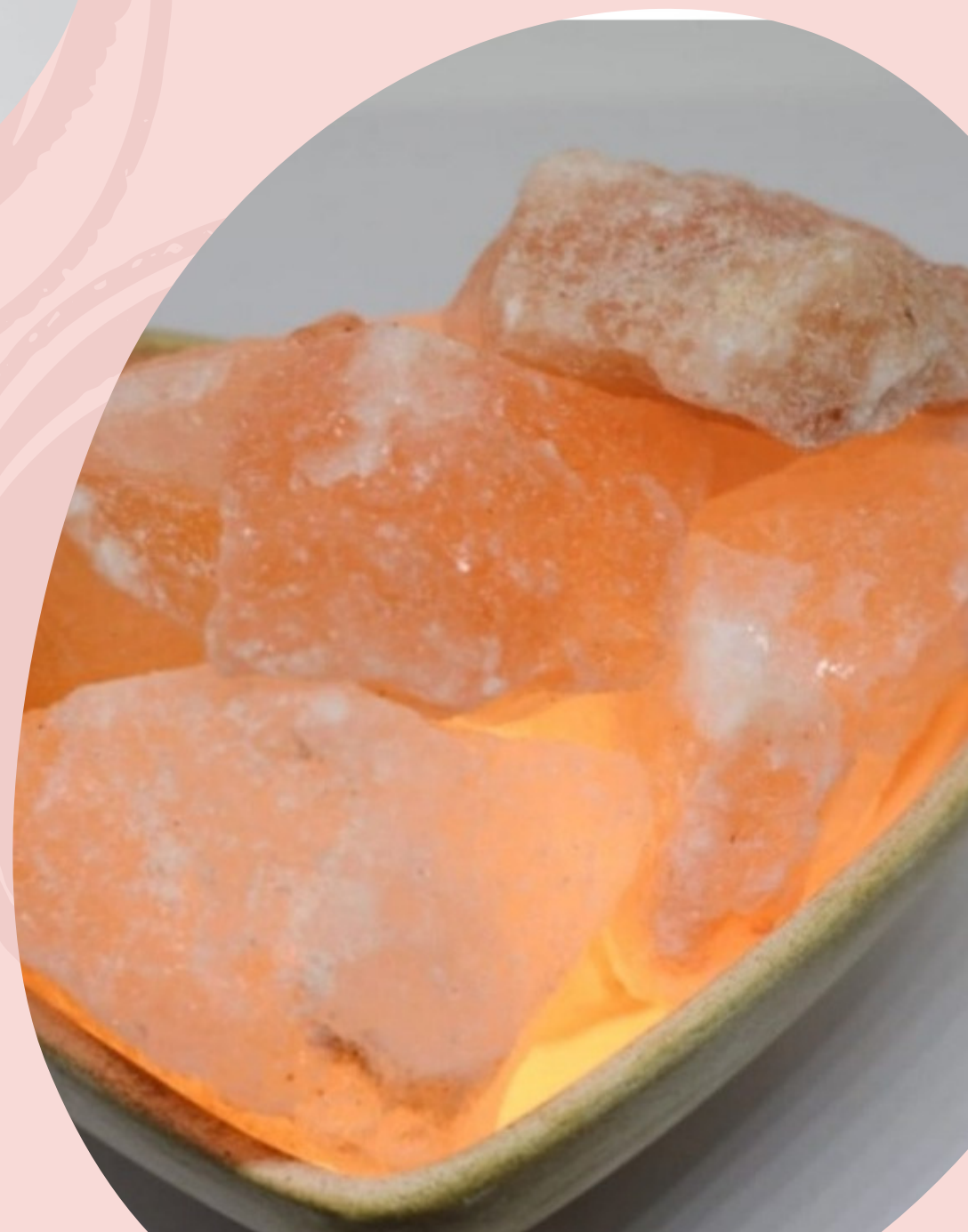
Lampara de Sal y cerámica con forma de corazón con cable y foco. (Línea económica)