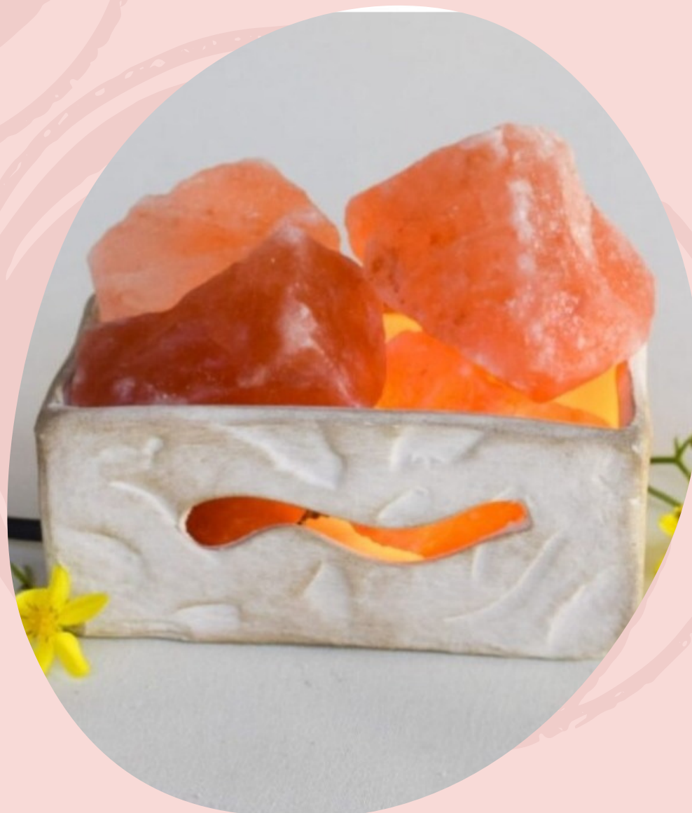
Lampara de Sal infinito con cable y foco (Línea económica)