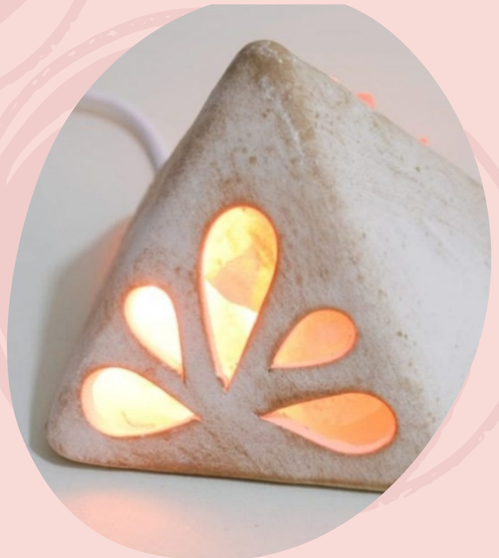
Lampara de Sal y cerámica Pirámide. Con cable y foco (Línea económica)