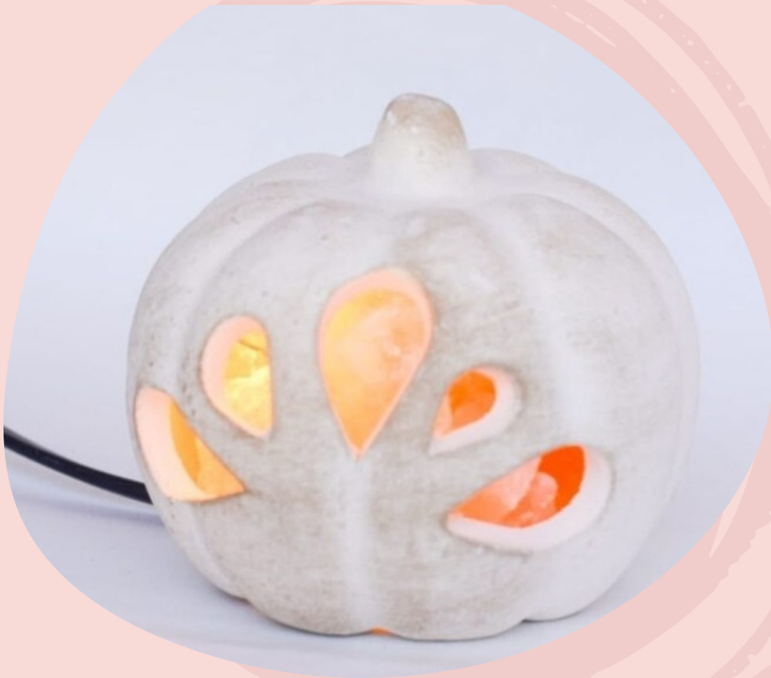
Lampara Calabaza con cable y foco. (Línea económica)