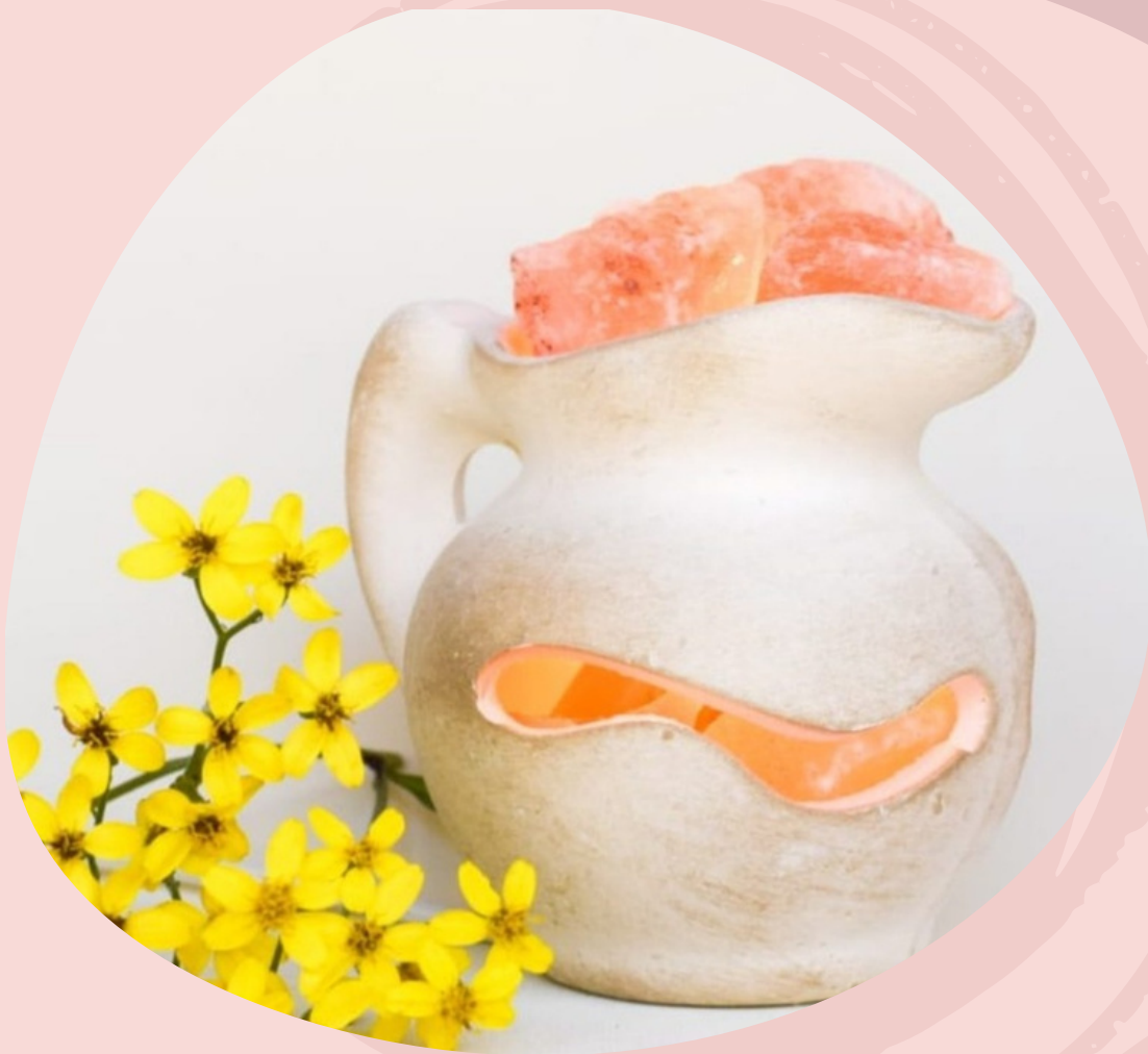
Lampara limpieza profunda con cable y foco. (Línea económica)