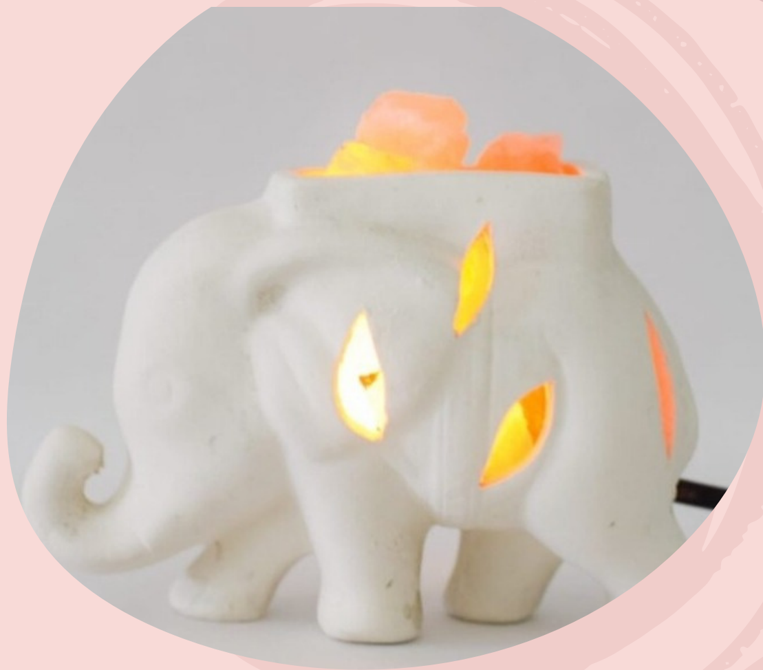
Lampara de Sal del Himalaya y cerámica. Con cable y foco. (Línea económica)