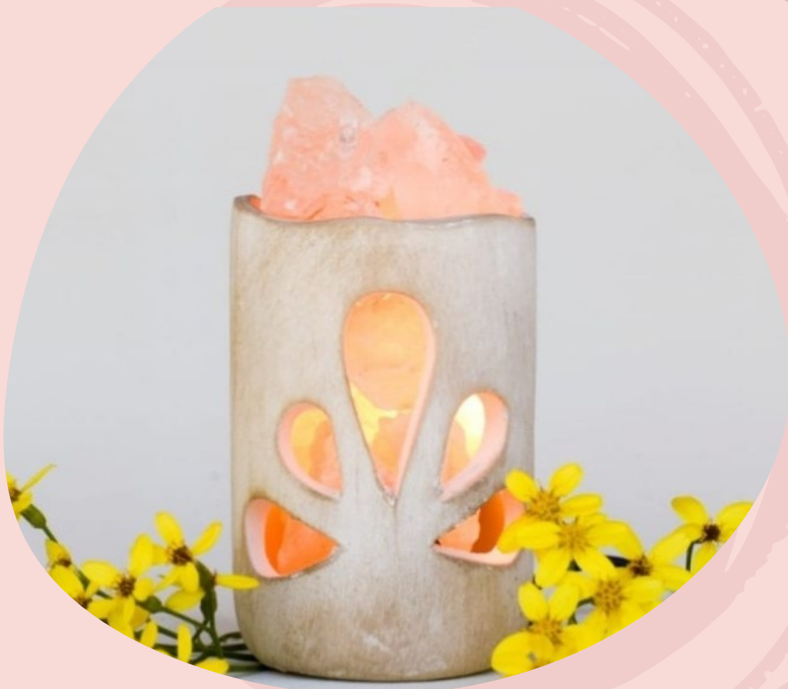
Lampara Poderes con cable y foco. ( Línea económica)