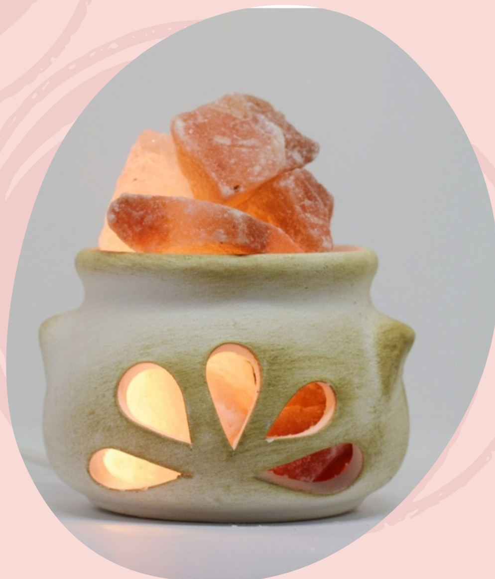
Lampara luz con cable y foco.(Línea económica)