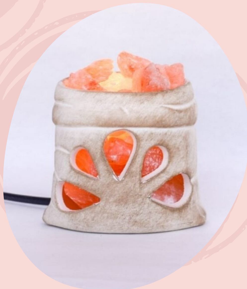
Lampara de Sal Misterio con cable y foco.(Línea económica)