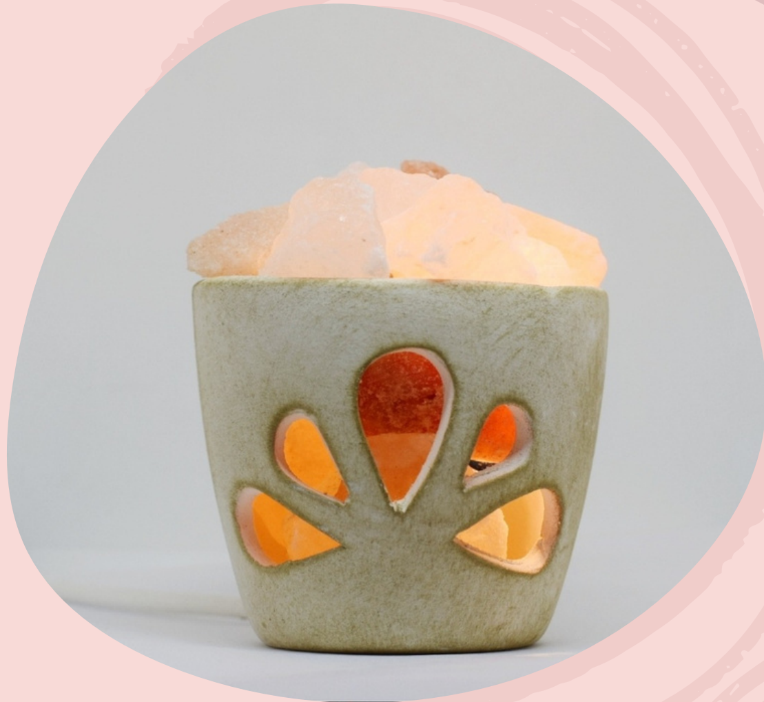
Lampara cuenco con cable y foco.( Línea económica)