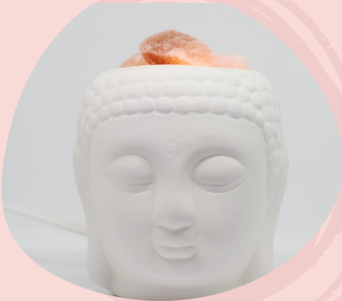
Lampara de Sal y cerámica Buda con cable y foco (Línea económica)